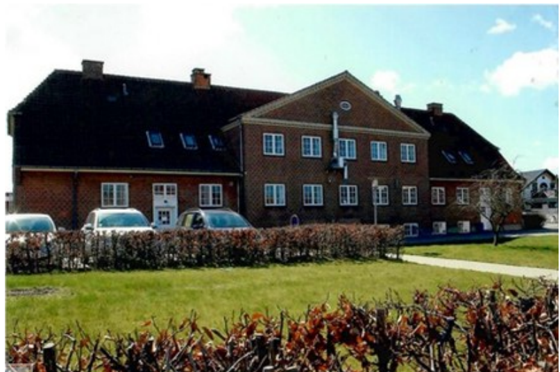
Idestrup Plejehjem set fra 'haven'