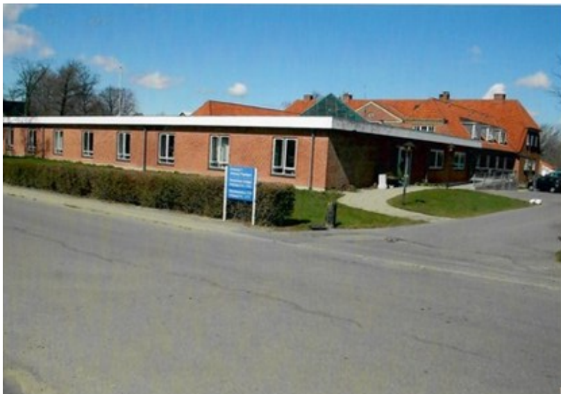
Idestrup Plejehjem set fra Kirkevej

I 1990 bygges i tilknytning til plejehjemmet 7 'beskyttede' boliger og i 2005 blev der også i tilknytning til plejehjemmet bygget en afdeling med 12 små lejligheder, kaldet "Blomsterhaven" fortrinsvis til demente borgere.