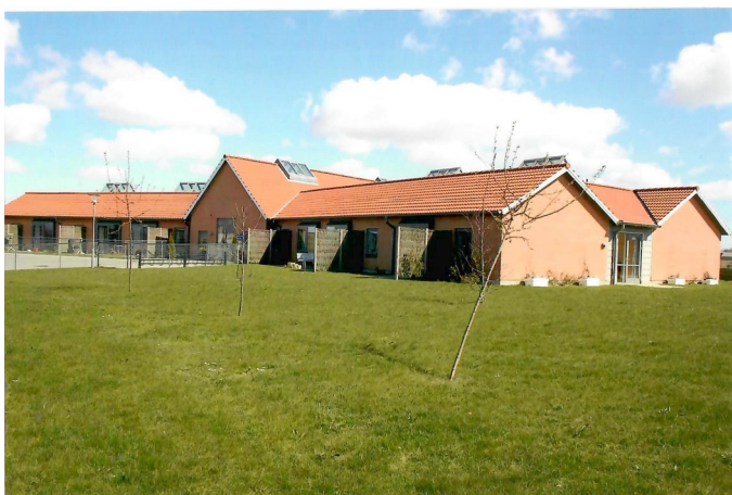
Blomsterhaven. Demensafsnit opført 2005.