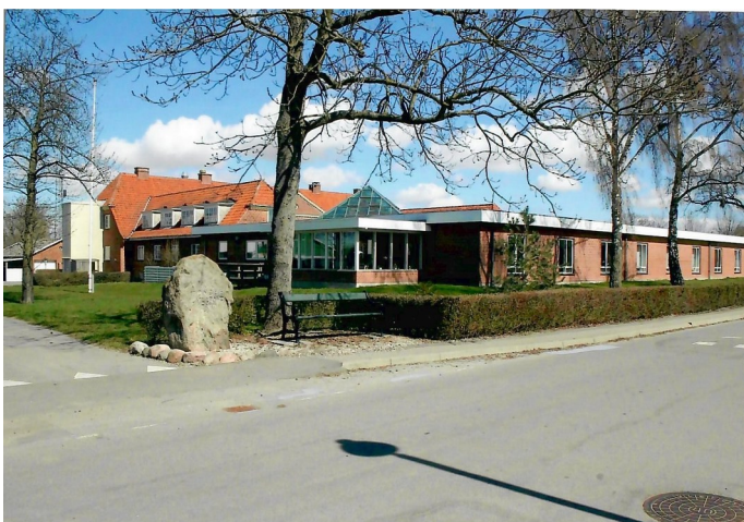
Idestrup Plejehjem set fra Kirkevej