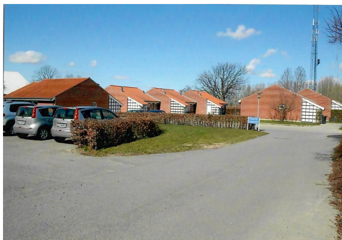
Beskyttede boliger opført i 1990. I alt 7 boliger.