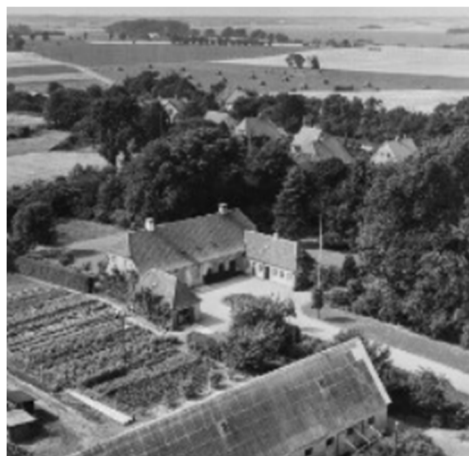
Idestrup præstegård 1959 - Danmark set fra luften

Menighedsrådet holdt imidlertid fast ved at bygningerne var uden kunstnerisk og historisk værdi – og de gik af med sejren. I sommeren 1928 går man i gang med at opføre en ny præstebolig. Den kom til at koste 32.591 kr. Den 8. december 1927 kunne arkitekt Albert Pedersen, Nyk.F, der havde tegnet og stået for byggeriet, overdrage den nye præstegård til menighedsrådet 12