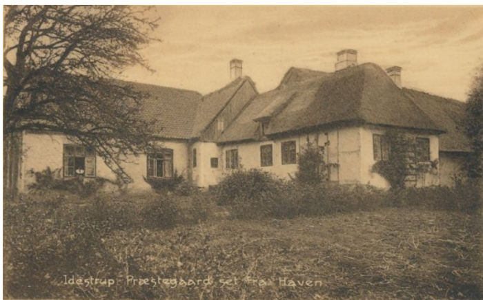
Idestrup præstegård anno 1910 (set fra haven). Denne gamle præstegård er nedrevet omkring 1926/1927 for at gøre plads til den nuværende præstegård

Seneste præstegård er bygget 1928. Der er ikke tale om en gård i gammeldags forstand. Der er hverken stalde eller lader i bygningen. Det var der i den gamle stråtede præstegård hvorfra præstegårdsjorden blev dyrket. 60 tønder land hørte der til præstegården. Det var almindeligt at en del af præstens, degnens og smedens løn blev ydet på den måde at de fik et stykke jord at dyrke.